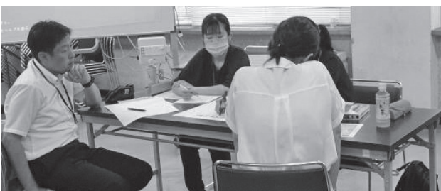
第1回推進委員会の様子

テーマは「目的・場面・状況に応じて、伝えたい内容を適切な表現を用いて伝えようとする生徒の育成」です。共通の深い学びの技法を各校で実践していきます。